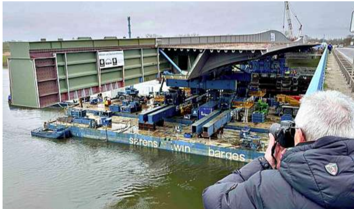
Hier fand der Vorschub des dritten Taktes mithilfe eines mitschwimmenden Pontons statt.

Viele Interessierte und Neugierige waren auf dem Deich nahe der Baustelle für die entstehende Elbquerung der A14. Nicht von ungefähr, denn hier fand der Vorschub des dritten Taktes mithilfe eines mitschwimmenden Pontons statt.