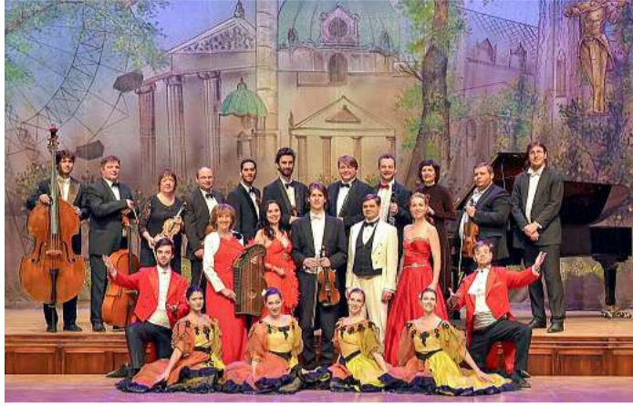
Zauber der Operette

Am Sonntag, den 9. Februar findet im Kultur- und Festspielhaus Wittenberge ein eindrucksvolles Konzert mit den bekanntesten Melodien der Väter der Operette statt.